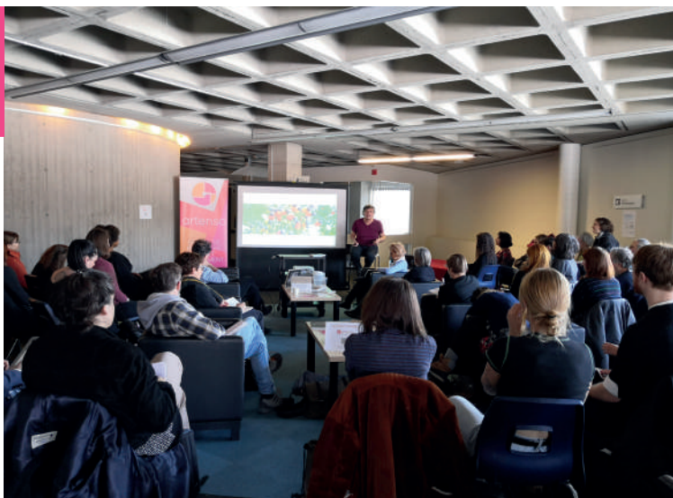
Art et écologie , Conférence de Paul Ardenne, 31 janvier 2020

Les médiations numériques – Accompagner les publics dans leur fréquentation des arts de la scène. Conférence, Forum RIDEAU, Québec, 18 février 2019