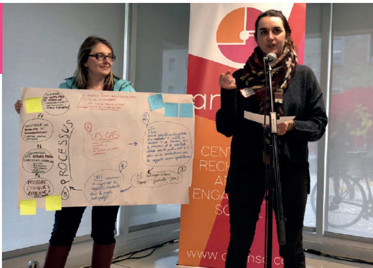
Remix ta médiation ! Quelles innovations dans l'accompagnement ? , 18 octobre 2019