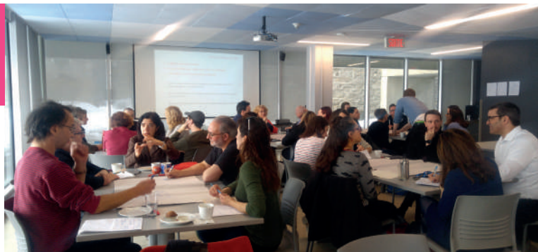
ARTENSO 101. La médiation culturelle au cégep de Saint-Laurent. Art, environnement numérique et innovation sociale, 14 mars 2019

Médiation artistique et rencontre interculturelle. Recenser, documenter et comprendre les interventions artistiques et culturelles avec les groupes en francisation au CSL. Étude, novembre 2019