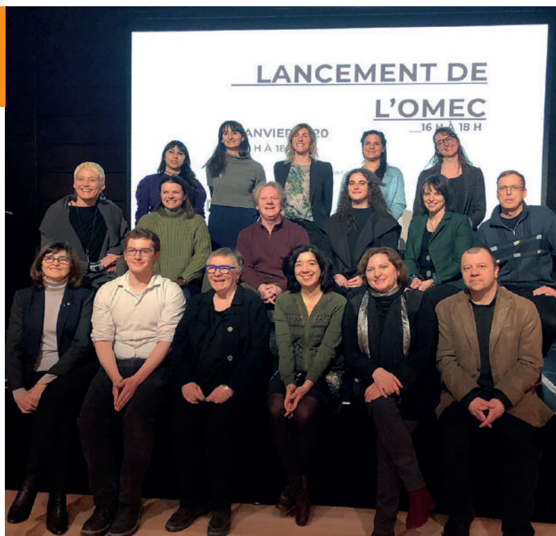
Lancement de l'OMEC, 17 janvier 2020

ARTENSO se trouve au cœur d'un riche écosystème de production et de recherche en médiation culturelle et numérique. Le centre se distingue par les relations de coopération qu'il a établies auprès de sa communauté professionnelle comme au sein du milieu collégial.